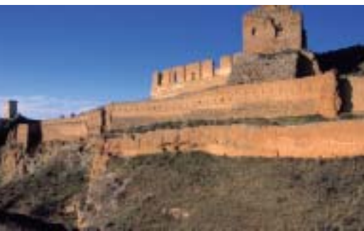
Cámbrico. Castillo de Daroca

El Cámbrico está constituido por varias formaciones. En primer lugar, las Dolomías de Ribota , dispersas en varios afloramientos, pero constituyendo una estrecha banda que desde Villanueva de Jiloca se prolonga por la margen derecha del Jiloca hasta el castillo de Daroca. A las dolomías se le superpone un conjunto monótono, de más de 2.000 m. de una serie pizarroso-cuarcítica, constituida por las Pizarras de Huermeda , Areniscas de Daroca y las formaciones Valdemiedes ,