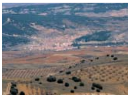
Daroca, desde el puerto de Santed

Por el norte, los estrechos de Murero y las sierras de Algairén-Herrera la limitan con las de Calatayud y Campo de Cariñena, y por el E, el piedemonte nororiental de la sierra de Herrera y las vertientes de los ríos Herrera y Cámaras la comunican con la comarca de Belchite. Por el sur, comparte con la Comarca de Calamocha espacios tan singulares como son: la cuenca de Gallocanta, la vega del Jiloca o el Campo Romanos