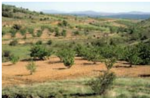
Val de San Martín. Cuenca del Jiloca

Constituye el eje central en torno al cual se articula la comarca. Está formado a su vez por tres subunidades: la peniplanicie de Valdehorna-Balconchán-Orcajo , al oeste; la vega del Jiloca en el centro, donde se asientan las localidades de Villanueva de Jiloca , Daroca , Manchones y Murero , y la margen derecha, con un relieve más abrupto y una red erosiva dendrítica donde se encuentran las localidades de Retascón , Nombrevilla y Anento .