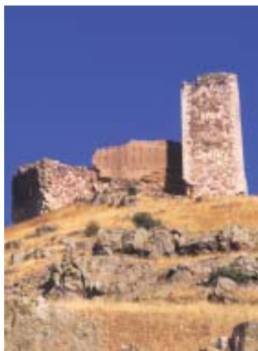
Ordovícico. Castillo de Santed

Mansilla , Murero y Acón , que dan lugar a los relieves más suaves de la margen izquierda del Jiloca. A nivel regional, son las series que han proporcionado mayor cantidad de fósiles, entre ellos asociaciones de braquiópodos y, sobre todo, de trilobites que han permitido dataciones muy precisas y el establecimiento de una estratigrafía muy detallada en la zona de Murero.