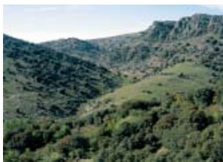
Puerto de Santed, desde Val de San Martín

El sustrato geológico, es decir, el suelo comarcal, está constituido por terrenos de origen sedimentario, terrenos que se originaron en medios marinos y continentales 1 , durante un periodo de más de 500 millones de años 2 , desde el Cámbrico hasta la actualidad.