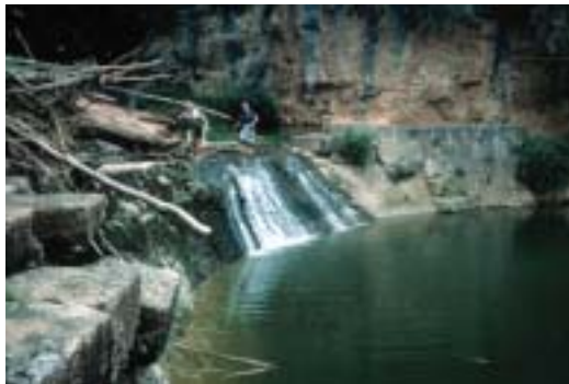
Azud en las Hoces de Torralba de los Frailes

La Comarca de Daroca constituye un compendio de la historia geológica terrestre. Materiales de la mayor parte de la historia geológica terrestre, fósiles representativos de todos los periodos, algunos tan específicos como los trilobites de Murero o los vertebrados de Nombrevilla y Daroca . Estructuras kársticas espectaculares como las desarrolladas en la zona del río Piedra . Plegamientos-deslizamientos bajo el mismo castillo de Daroca . Paisajes de las más bellas facturas, desde la laguna de Gallocanta a los manantiales de Agullueve en Anento o desde los páramos del Campo Romanos al verdor de la vega y de los viñedos del Jiloca , conforman un territorio de grandes contrastes y una belleza singular.