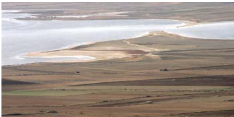
Laguna de Gallocanta, desde el Castillo de Berrueco

algún dato geológico, sobre su origen y desarrollo. Se trata de una fosa tectónica, alargada según la dirección ibérica NNO-SSE, situada a unos 1.000 m de altitud y limitada al NE por la sierra paleozoica de Santa Cruz , al SO por la paramera calcárea de Torralba de los Frailes y al SE por materiales triásicos impermeables. Todo el vaso de la laguna está constituido por arcillas, yesos y sales triásicas que la impermeabilizan y, a la vez, le aportan su salinidad. La formación y posterior desarrollo de la fosa están condicionados por la existencia de una falla normal, la falla de Gallocanta , situada a lo largo de todo el borde nororiental, del borde paleozoico, límite rectilíneo que ya es indicativo, él mismo, de un frente tectónico. El hundimiento comenzó a finales del Plioceno y continua durante el Cuaternario, a una velocidad superior a la de la erosión remontante de las ramblas de la margen occidental del Jiloca, de no ser así la cuenca ya habría sido capturada. El límite suroccidental lo constituyen las suaves parameras calcáreas en descenso progresivo hacia la laguna. El fondo actual, aparte de los triásicos, se compone de sedimentos cuaternarios superficiales (gravas, arenas y arcillas) aportados por los arroyos circundantes. Su alimentación proviene de aguas superficiales, por el borde NE y subterráneas por el SO, situación reflejo del diferente comportamiento permeable de unos y otros materiales.