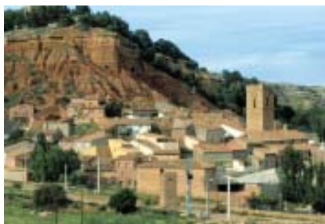
Terciario. Castillo de Anento

Hacia finales de los tiempos jurásicos, hace unos 135 MA, comienzan a mostrarse las primeras manifestaciones de la orogenia alpina. Durante el Cretácico Inferior , amplias zonas ocupadas por mares someros, emergen y dan lugar a extensas áreas litorales, en las que se desarrolla una prolífica vida continental, es la era de los dinosaurios . En la comarca no existe registro geológico de este periodo, se encontraba emergida y alejada de las áreas de sedimentación 5 .