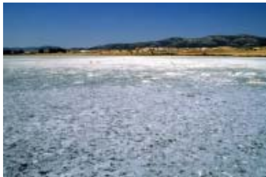
Laguna de Gallocanta

Por último, la Fosa de Gallocanta , la más reciente, sigue su proceso evolutivo. Su continuidad depende del equilibrio entre el hundimiento tectónico que propicia su misma existencia y la acción erosiva del Jiloca. Estamos hablando a escala geológica; si el hundimiento es mayor, la cuenca tenderá a agrandarse y si por el contrario, prima la actividad erosiva, la cuenca será capturada por el Jiloca, dado que su nivel de base es mucho menor.