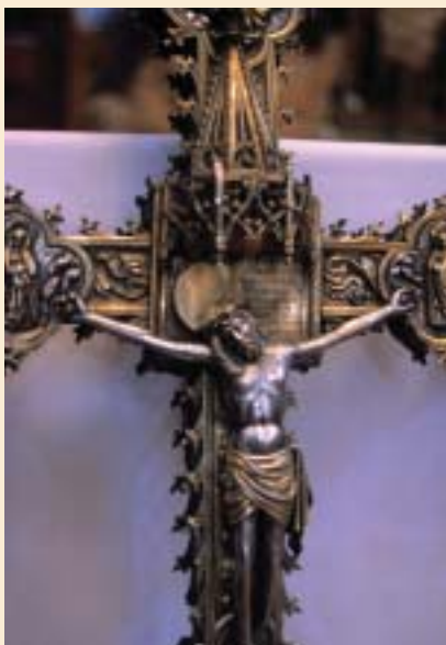
Villanueva. Cruz procesional. Siglo XVI