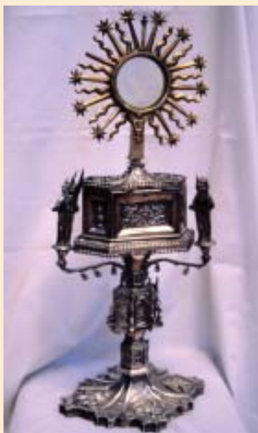
Villanueva. Custodia. Siglo XVI